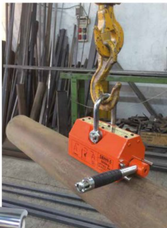
Con pulsante di sblocco in testa alla leva